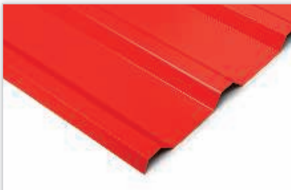
FLORIAN CENTRUM, Blachy T-35 . Polecane przede wszystkim na duże obiekty typu budynki przemysłowe, hale, wiaty. W ofercie szeroka gama kolorów tych blach. Możliwość zamówienia blachy na żądanej długości stwarza dodatkowe oszczędności i ułatwienia związane z montowaniem arkuszy.