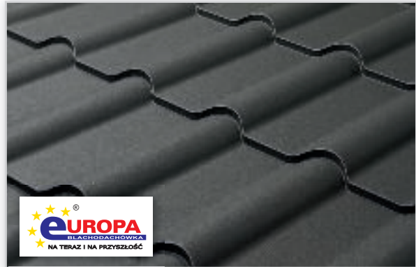
FLORIAN CENTRUM, Blachodachówka Europa . Idealna do szybkiego i taniego pokrycia dachu domu lub budynku. Ma wiele zalet. Przetłoczenie fali zapewnia blachodachówce optymalną sztywność, a zastosowane rowki kapilarnie umożliwiają odprowadzenie wody skraplającej się na połączeniach arkuszy. To idealny materiał na nowe jak i remontowane dachy. Pokrycie dachowe z blachy powlekanej dzięki dużej ilości dostępnych kolorów gwarantuje elegancki wygląd i wiele lat użytkowania.