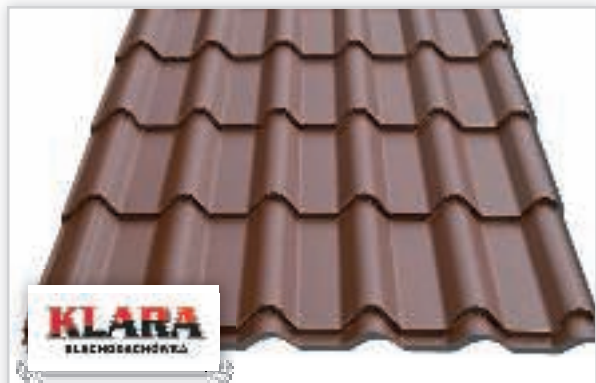
FLORIAN CENTRUM, Blachodachówka KLARA – to nowy produkt wprowadzony do oferty Florian Centrum S.A. Charakteryzuje się wysokim profilem. Bardzo ładnie prezentuje się na domach i budynkach.