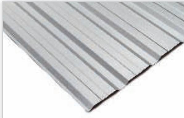
FLORIAN CENTRUM, Dachowa (z rowkiem odwodnieniowym) i elewacyjna blacha trapezowa T-18 E z wzmocniającymi przetłoczeniami fal i bardzo wydajnej szerokości użytkowej. Zalety: efektywna, efektowna i ekonomiczna. Stosowana jako pokrycie budynków gospodarczych, sufitów, wiat, hal magazynowych i wszelkiego typu obiektów przemysłowych.